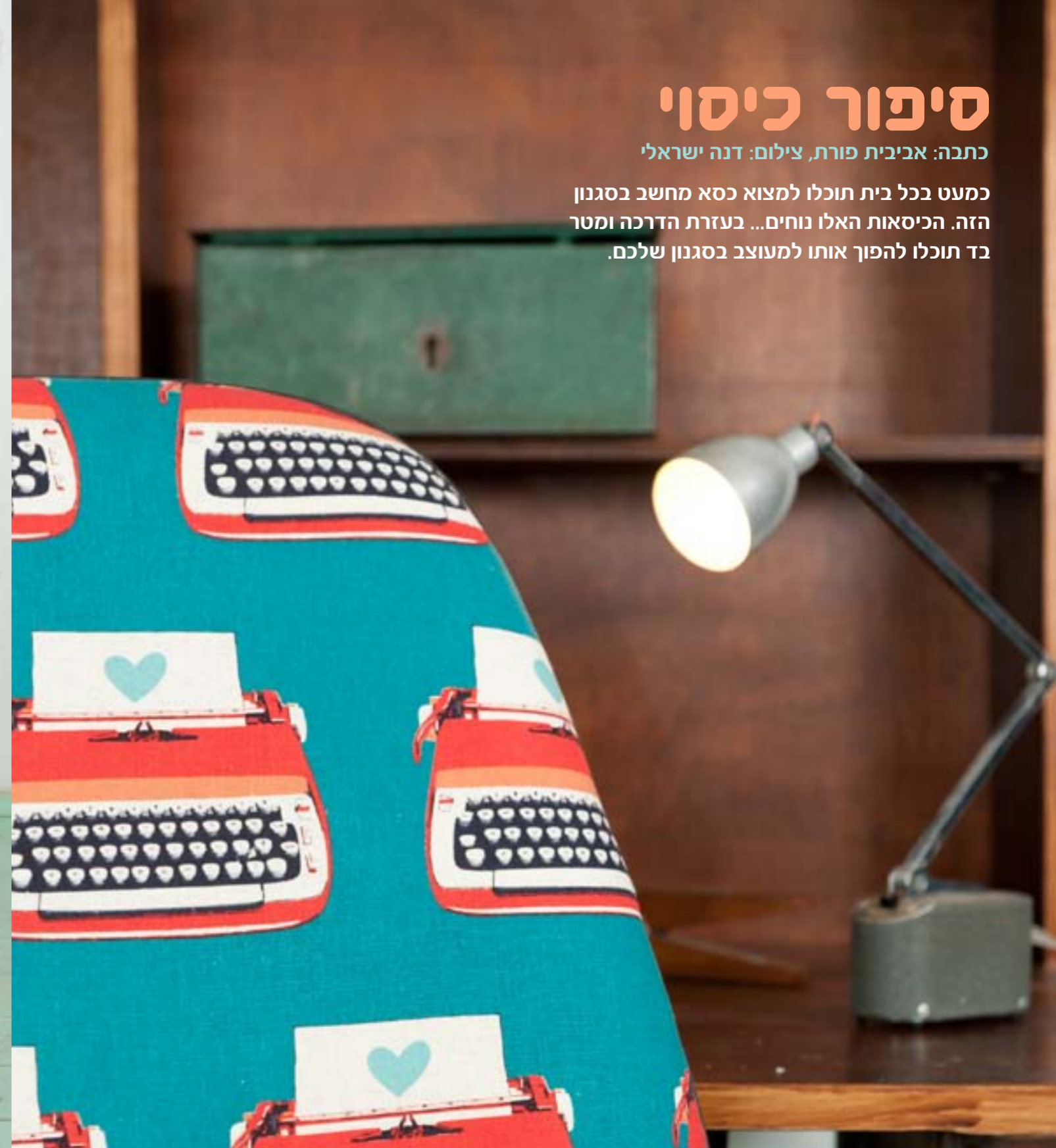
אביבית פורת - הינה רפדית ובעלת סטודיו לסדנאות - סיפור כיסוי http://coverstorytlv.blogspot.co.il , פייסבוק: סיפור כיסוי